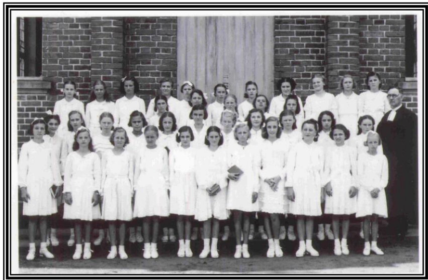
Grupo das Confirmandas de 1940